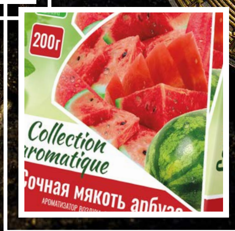
СЕРИЯ COLLECTION AROMATIQUE